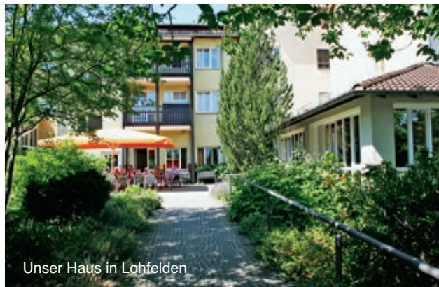
Unser Haus in Lohfelden