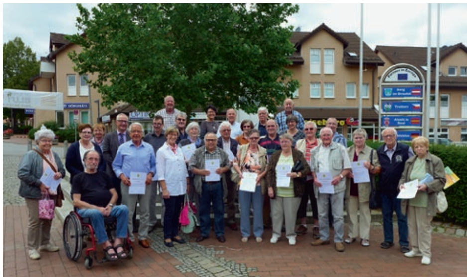
Der aktuelle Lohfeldener Seniorenbeirat

In den letzten Jahren hat sich die Einsamkeit älterer Menschen in Deutschland verdoppelt. Das muss und darf in Lohfelden nicht sein. Nehmen Sie unsere Angebote an, denn Sie selbst können sich so vor dem Alleinsein schützen. Und wir wollen Ihnen dabei helfen.