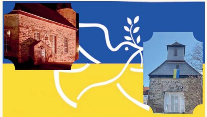
Evangelische Kirchengemeinde Lohfelden